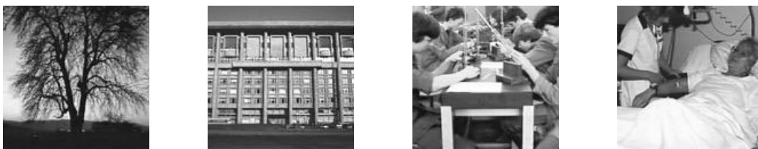
Abbildung 1 : Beispielbilder aus der Datenbank des Schweizer Fernsehens

Als Benutzerexperiment haben wir 14 Bilder aus der Bilddatenbank als Anfragen ausgewählt. Drei Benutzer haben zu jedem dieser Bilder alle für sie relevanten Bilder aus der Datenbank herausgesucht. Das Ergebnis ist, daß die Anzahl der ausgewählten Bilder abhängig von der Person sehr unterschiedlich ist (zwischen 4 und 32), und daß zum Teil sehr unterschiedliche Bilder ausgesucht werden. Im Mittel wurden 19 Bilder als relevant markiert. Als Bewertung der Performance des Systems benutzen wir Precision/Recall (PR) Graphen , die im Text Retrieval der Standard sind und auch im CBIR immer häufiger benutzt werden. PR Graphen beschreiben das Antwortverhalten eines Systems sehr gut. Als Datenbank benutzen wir 2500 Bilder des Schweizer Fernsehens "Télévision Suisse Romande". Die Datenbank enthält sehr verschiedene Bilder, kleine Gruppen von wenigen untereinander ähnlichen Bildern kommen vor (siehe Abbildung 1).